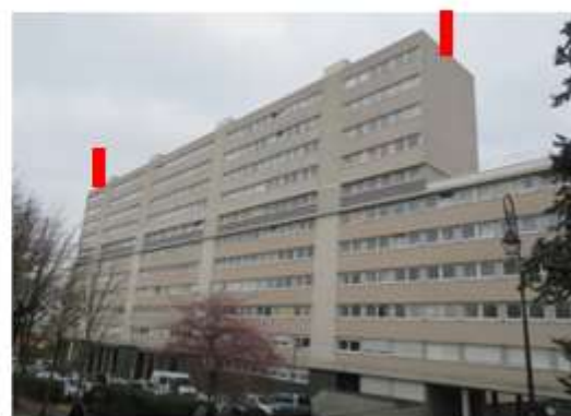
Vue depuis le marché couvert, avenue de Verdun