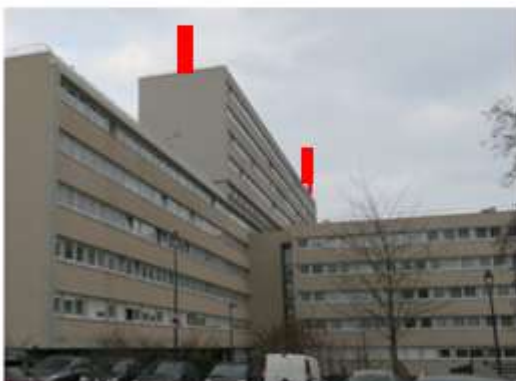
Vue depuis la Maison de la musique et de la danse