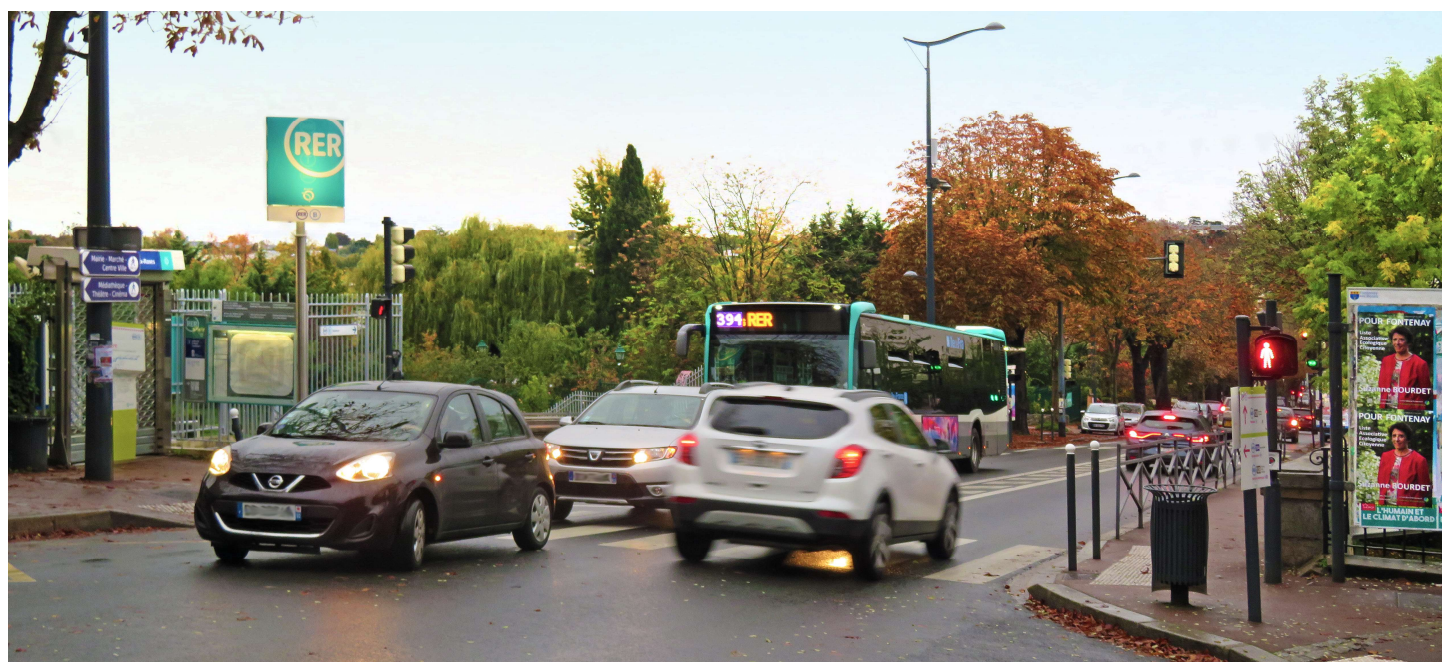
Avenue Lombart, point de rencontre des mobilités : piétons, vélos, voitures, bus et RER

Salle municipale de l'Eglise, 3 avenue du Parc.